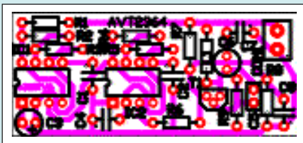
Rys. 2 Schemat montażowy

Po zmontowaniu układu przyjdzie pora na jego zestrojenie. I tu ważna uwaga: