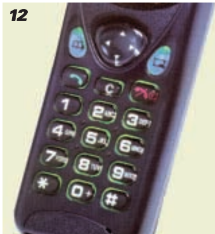
12 Telefon o klawiszach odpowiedniej wielkości, wygodnie rozmieszczonych.

Trudno mi podać gotowy sposób na kupowanie „komórki”. Nowe modele pojawiają się praktycznie co kilka miesięcy. Każdy z nas – klientów – ma inny gust i potrzeby. A także możliwości finansowe. Mogę jedynie zaproponować kilka zasad, które powinny być uwzględnione podczas dokonywania upragnionego zakupu.